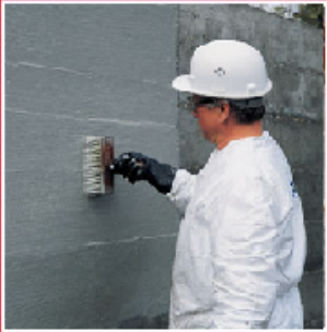
Fırça ile uygulama