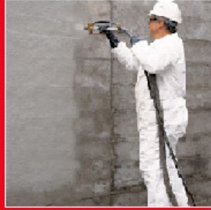
Sprey ile uygulama

Çimento esaslı, tek bileşenli, kristarilize su yalıtım malzemesi