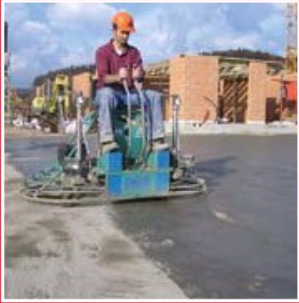
Helikopter ile uygulama