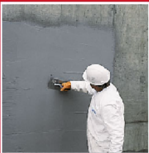
Mala ile uygulama