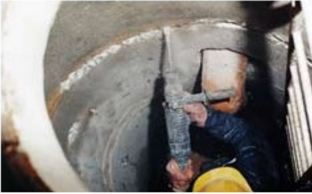
1. Çatlaklar ve derzlerin hazırlığı yapılır.