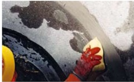
5. VANDEX RAPID S bir sünger yardımıyla düzleştirilir.