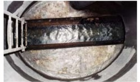
6. Yenilenmiş Menhol