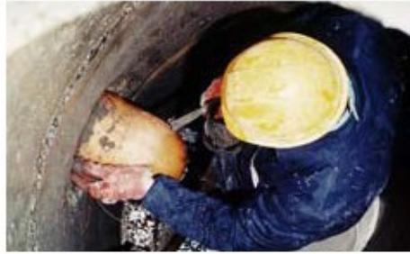
2. Hasar görmüş boruların içi ve derzleri tıkanır.