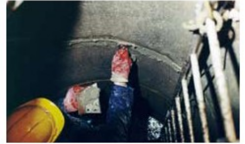
3. VANDEX RAPID M sızıntı olan derzlere uygulanır.