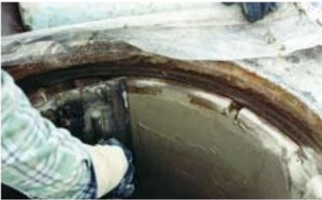
4. VANDEX RAPID S ile menhol'ün üst kısmı eski sıva düzeyine getirilir.